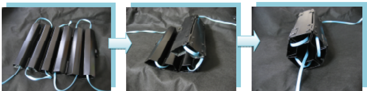
LAN ケーブルを本体に通し、本体を折り曲げてコードを収納する。