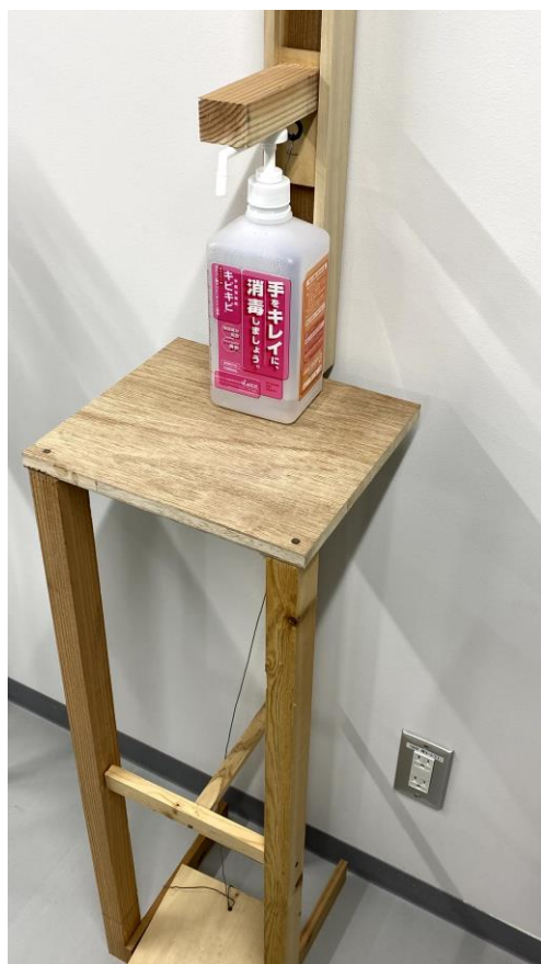
アルコール噴霧器の全体像

アームの可動部をスライドソーにより溝堀り加工することでアルコール消毒液の大きさに左右されずに使用できるようにした。初めは溝に対してぴったりの板材だったためうまくアルコール消毒液のポンプの力だけで戻ることができなかったが、やすりを使ってゆとりを持たせることでうまく動作するようになった。