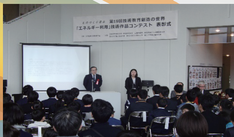
「エネルギー利用」技術作品コンテスト表彰式

技術教育に関して国内唯一の日本学術会議協力学術研究団体です。 技術教育は技術立国日本を創造するカギとなります。 ぜひ、活動に参加してください!!