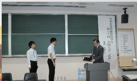
技術科指導能力認定試験表彰式