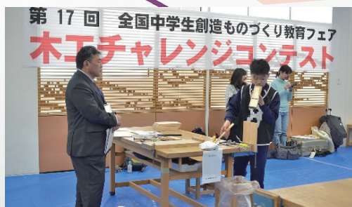
全日中木工チャレンジコンテスト支援